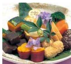
※握り寿司のプランもあります