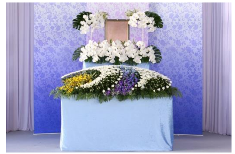
花祭壇 B タイプの場合