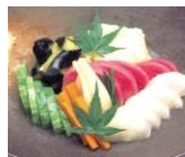
告別式お膳 10 名