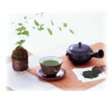
返礼品 25 セット