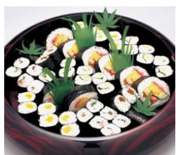
通夜料理 25 名様対応分

各祭壇に下記項目が共通して含まれます。人数の超過が無ければ追加料金はありません。