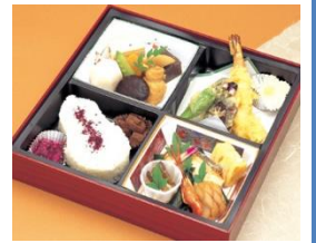
通夜料理 100名様対応分 寿司・揚げ物・煮物・香の物 ※握り寿司のプランもあります 告別式お膳 25名