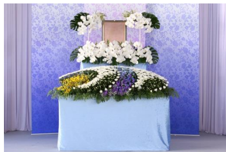
花祭壇 B タイプの場合