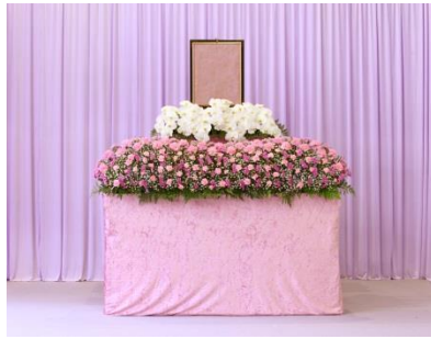
花祭壇 A タイプの場合