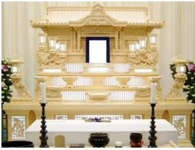
白木祭壇の場合 661,000円 税別